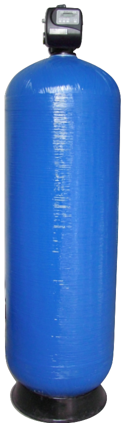
Filtru automat cu pat de cuarț Industrial