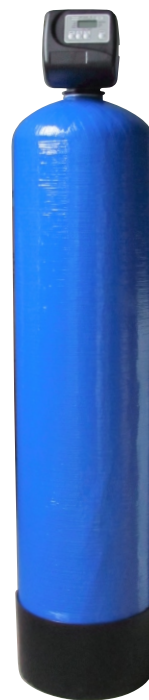
Filtru automat cu pat de cuarț Rezidențial